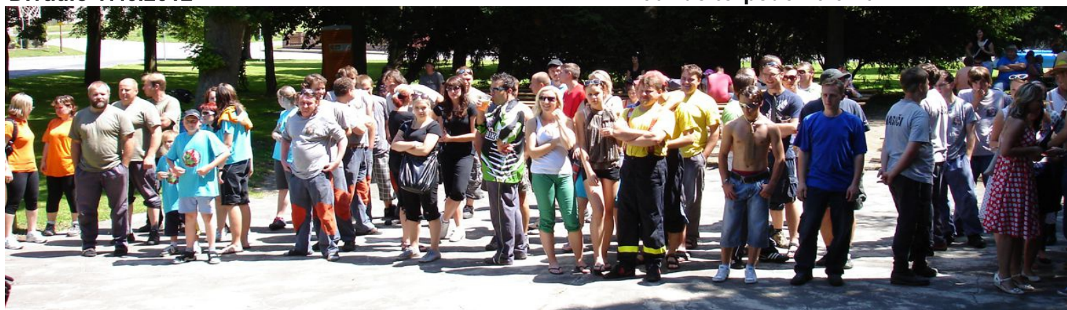
Hasičské z?vody 16.6.2012