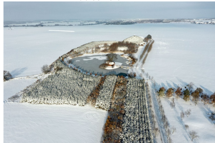
Kosice v zimním hávu