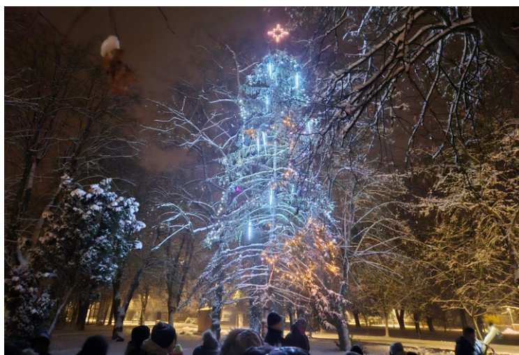
Rozsvěcení vánočního stromu