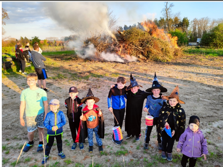
Čarodějnice 30.4. 2023