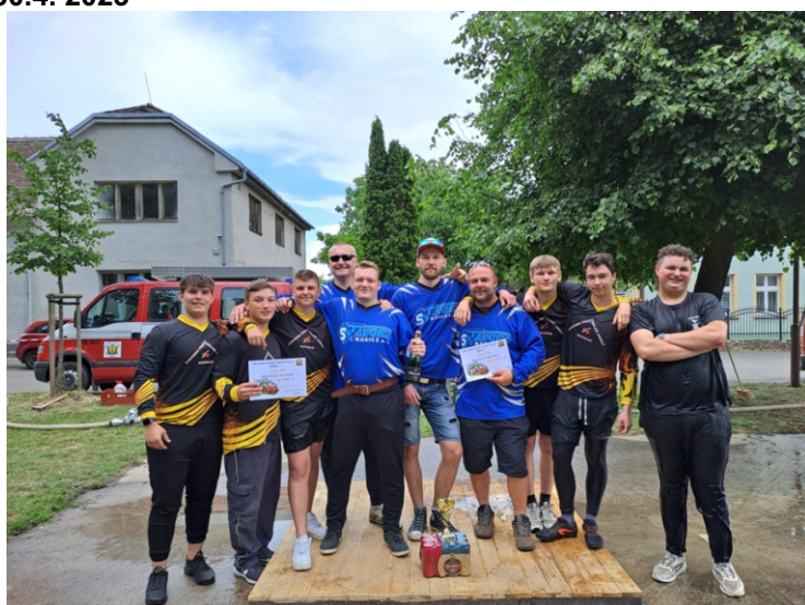
Závody SDH v Kosicích 17.6. 2023