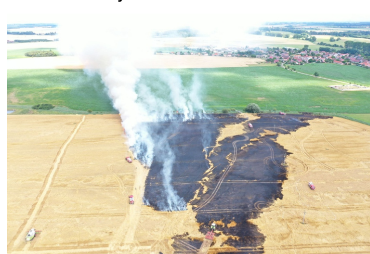
Požár pole u Kosic 2.7. 2023