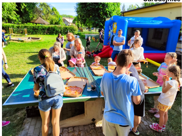
Dětský den 3.6. 2023