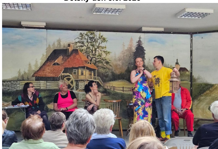
Divadlo 10.6. 2023