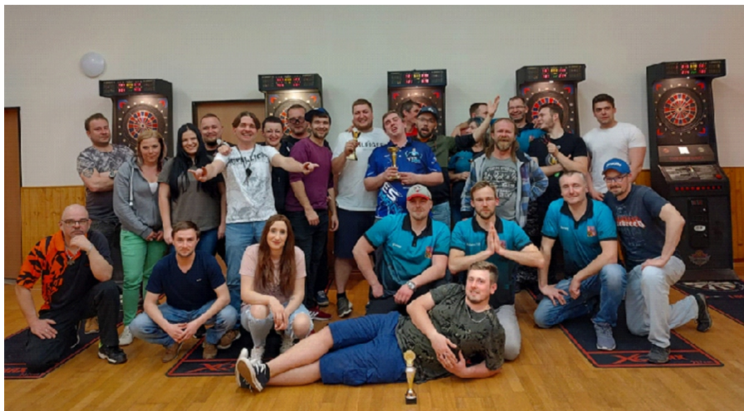
Turnaj v šípkách