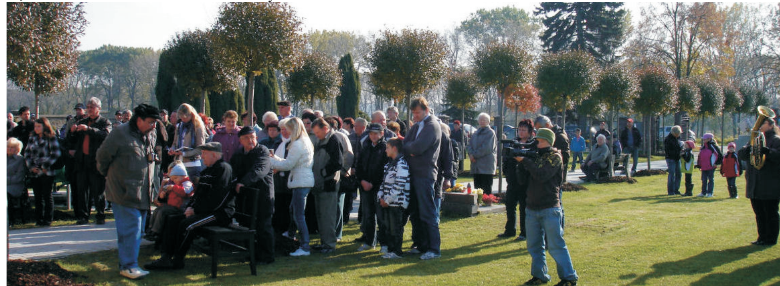
Žehnání zvonu 23.10.2010