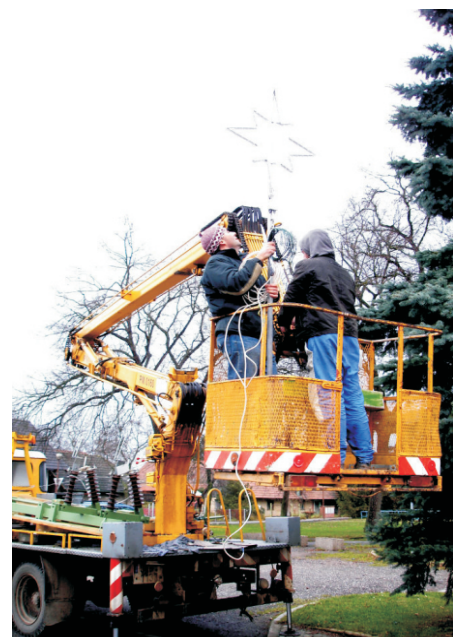
Zdobení vánočního stromu 23.11.2010