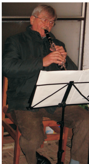
Slavnostní rozsvěcení vánočního stromu 27.11.2010