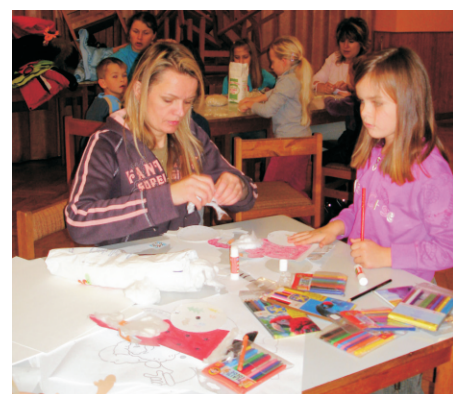
Výroba vánočních ozdob 8.12.2010