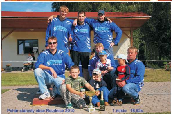
Pohár starosty obce Roudnice, 2010 1. místo 18.62s.