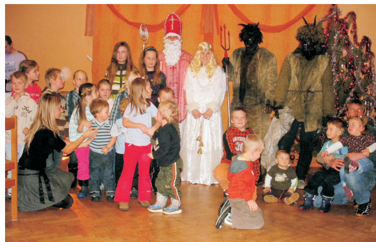
Mikulášská nadílka 4.12.2010