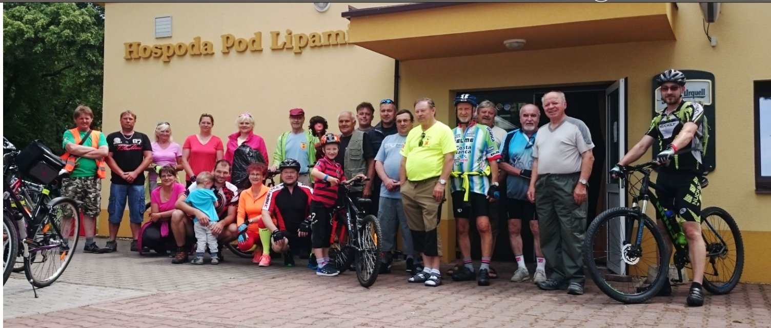
4.6 2017 Tour de Torpedo Kosice