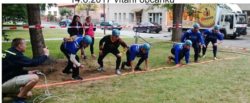
17.6.2017 hasiči závody