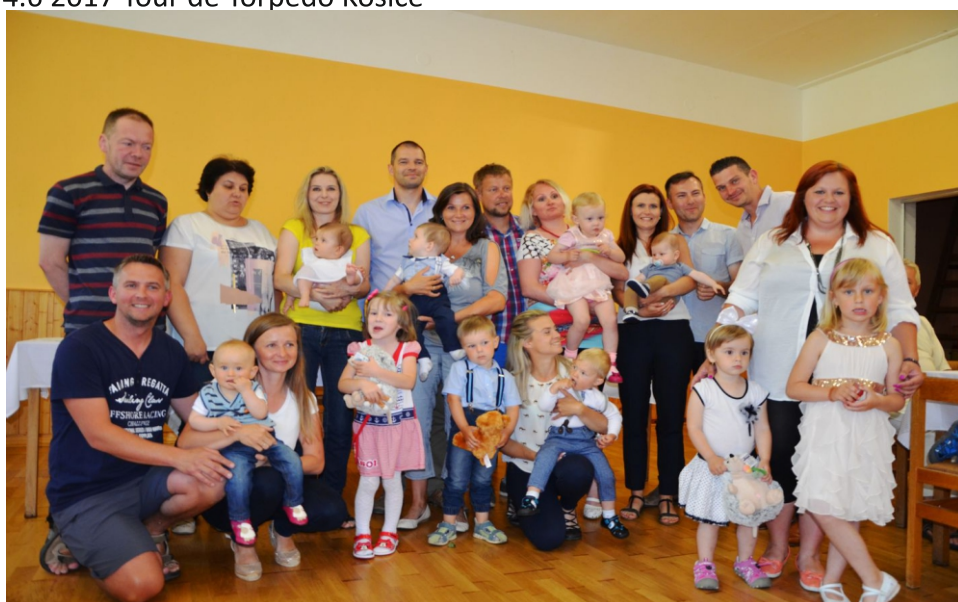
14.6.2017 vítání občánků