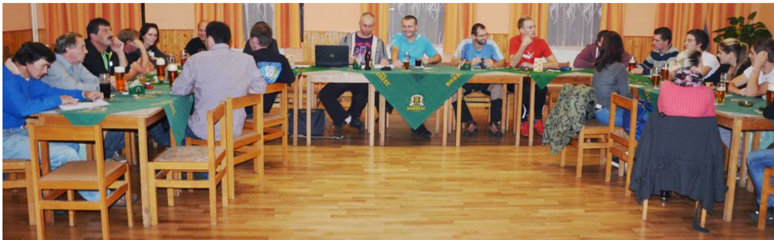
17.10.2014 členská valná hromada SDH Kosice