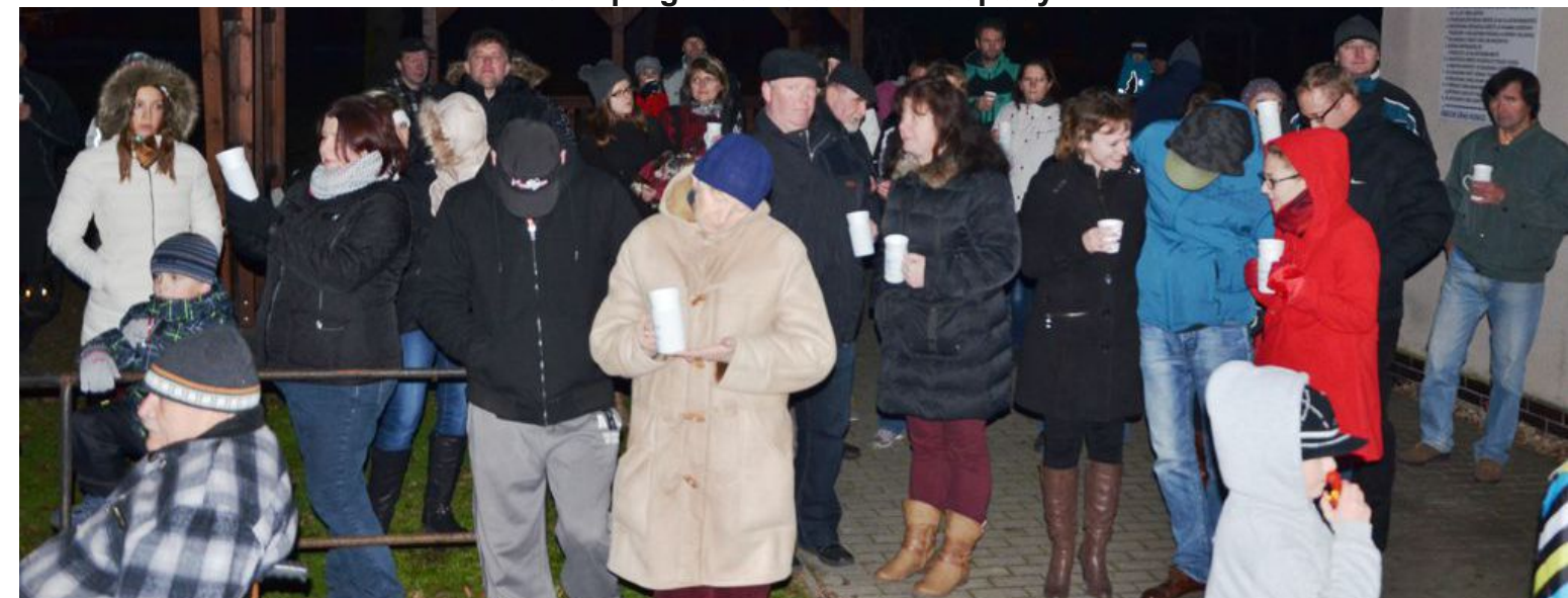
29.11.2014 rozsvěcení vánočního stromu