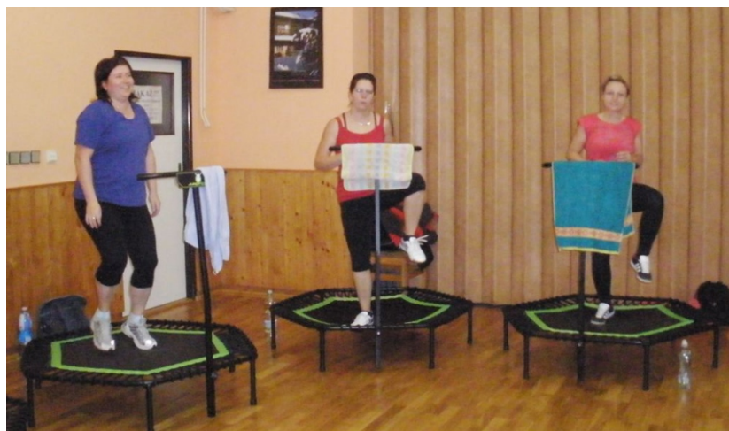
Jumping na sále obecní hospody