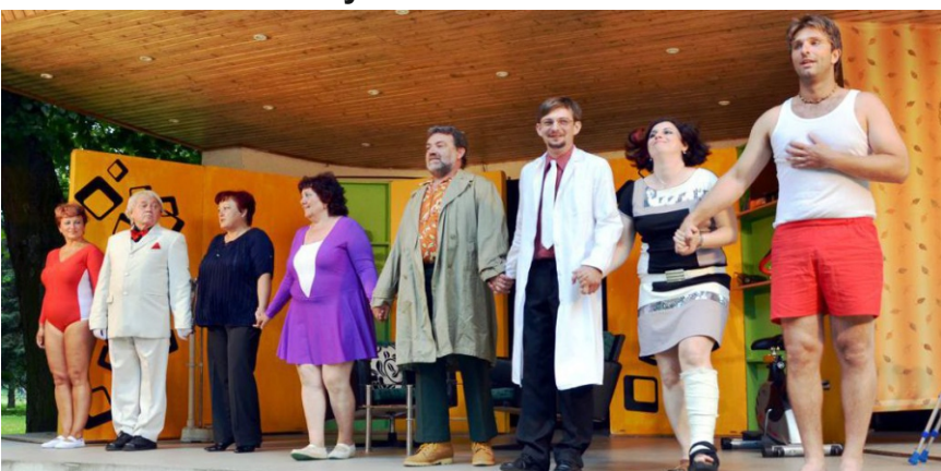
23.června 2013 divadelní představení