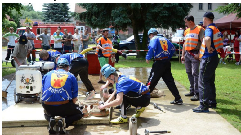
15. června 2013 hasičské z?vody