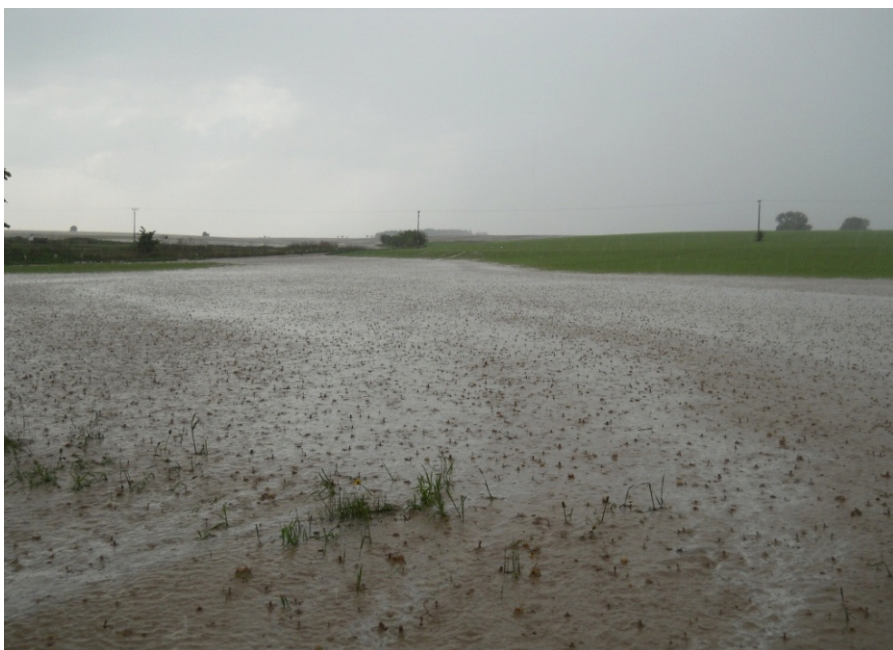
Srážky opustily zanesený meliorační příkop

Ani Koticím se letošní velká voda nevyhnula. První vlna přívalových dešťů zasáhla Kosice 9.května v odpoledních hodinách, kdy během jedné hodiny spadlo 41 mm srážek, druhá vlna pak 29.května v nočních hodinách, kdy napadlo během půl hodiny 50 mm srážek. Obě vlny měly stejný velice rychlý průběh. Dešťová voda z polí nad vesnicí, řádně obohacená jemnou zeminou se prohnala hlavně západní částí obce. Velkou vodou byly zasaženy hlavně domy v oblasti nové výstavby za Kovárnou a několik sklepů i v centru obce. Nejvíce škody voda napáchala v č.p.143. Postiženy jsou i zahrady ostatních občanů v této části obce. Díky rychlému a včasnému zásahu jak samotných obyvatel, sousedů a SDH Kosice bylo zabráněno obrovským materiálním škodám.