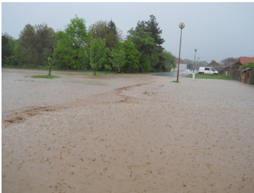
Srážky přetékají přes silnici III.třídy

Voda o sobě dala vědět ještě o několik dní později, když se začala plnit Bystřice a hrozilo její vylití. Byli jsme nuceni zavřít stavidlo do Mlýnské Bystřice a eliminovat tak možné ohrožení obce v jižní části. Toto opatření bylo od některých občanů spojeno s nepochopením, zájmy jednotlivce byly povyšovány nad zájmy většiny ohrožených občanů. O situaci na řece jsme byli včas informováni jak od Magistrátu Města Hradce Králové, tak od Povodí Labe. Situaci jsme sledovali dvě noci za sebou, v době když řeka Cidlina zaplavila Nový Bydžov, ale zvýšený průtok Bystřice nás nijak neohrozil.