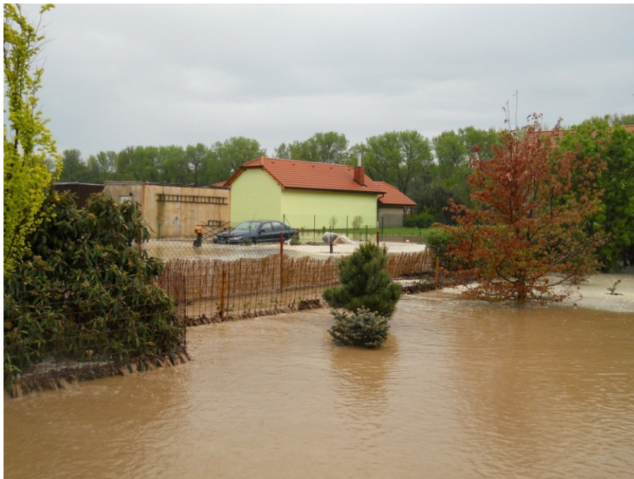
Pohled do zahrad při povodni

že se o to někdo postará. Všem, kteří se na úklidu obce podíleli, je třeba poděkovat a těm, kteří to nechápou, je třeba vyzvat, že někdy budou pomoc třeba taky potřebovat, tak by mohli přiložit ruku ke společnému dílu.