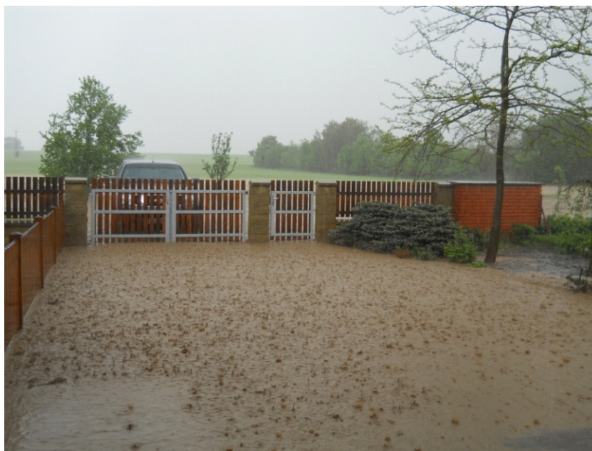
Pohled na blížící se povodeň z č.p.126

Voda o sobě dala vědět ještě o několik dní později, když se začala plnit Bystřice a hrozilo její vylití. Byli jsme nuceni zavřít stavidlo do Mlýnské Bystřice a eliminovat tak možné ohrožení obce v jižní části. Toto opatření bylo od některých občanů spojeno s nepochopením, zájmy jednotlivce byly povyšovány nad zájmy většiny ohrožených občanů. O situaci na řece jsme byli včas informováni jak od Magistrátu Města Hradce Králové, tak od Povodí Labe. Situaci jsme sledovali dvě noci za sebou, v době když řeka Cidlina zaplavila Nový Bydžov, ale zvýšený průtok Bystřice nás nijak neohrozil.