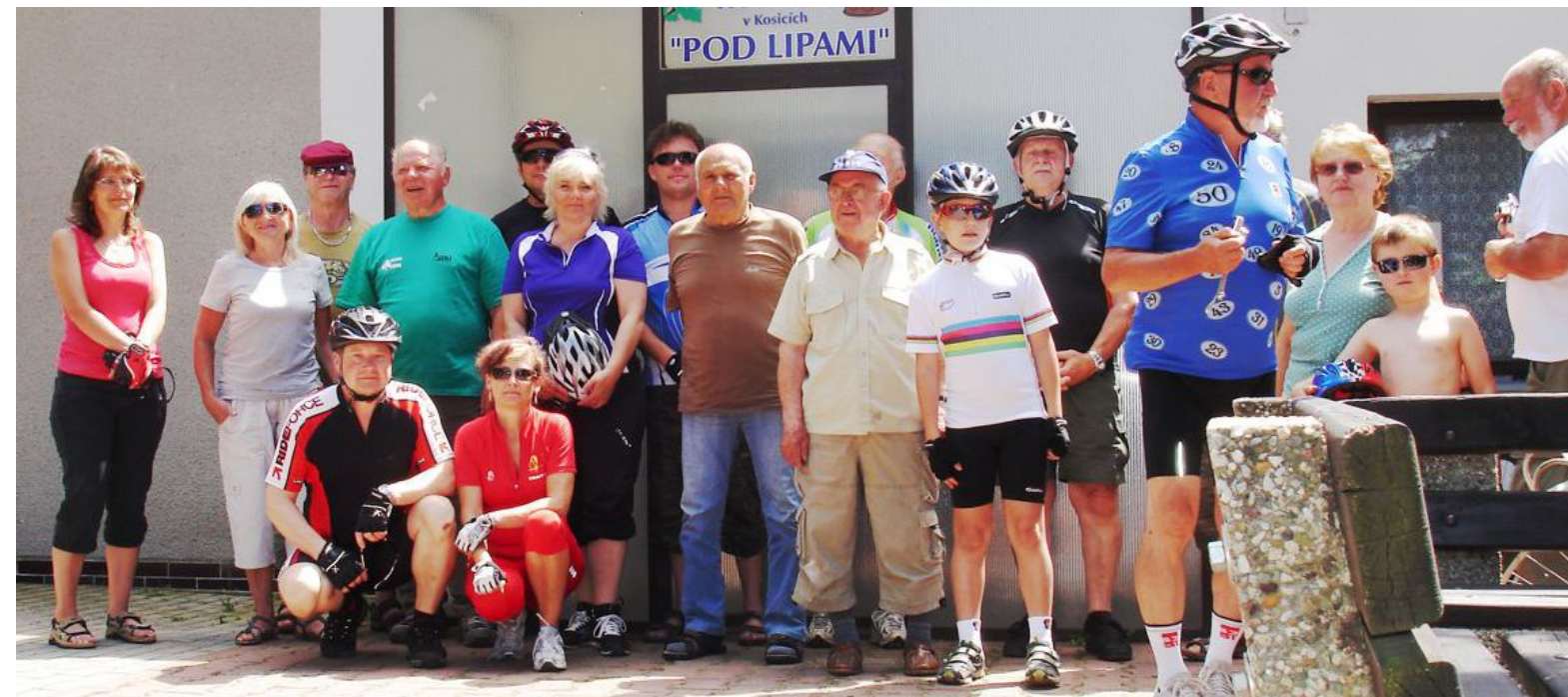
16. června 2013 Tour de Torpedo